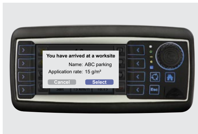
Erscheint auf dem Bildschirm des Steuergeräts, wenn der Streuer eine voreingestellte Arbeitsstelle erreicht.