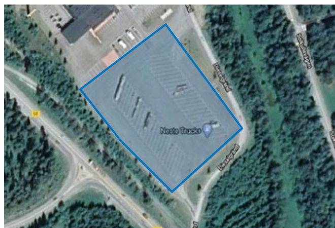
HTrack™ ermöglicht es Benutzern, Arbeitsflächen für ihre Kunden zu erstellen und zu hinterlegen. Sie können genau sehen, wie groß der Bereich ist, der behandelt wurde und die Menge des benötigten Materials.